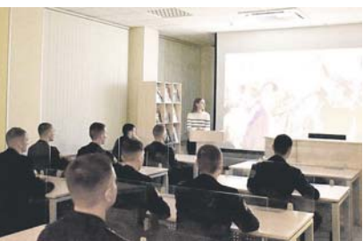
В кинолектории училища.

Работа по сплочению воинских коллективов и проработке нарушений уставных правил взаимоотношений между военнослужащими всегда находится в центре внимания командиров в офицеров военно-политических органов Красноярска высшего военного училища имени генерала армии С.М. Штеменко. В КВВУ уже традиционно доминируют новаторские подходы к решению задач по сплочению воинских коллективов. В вузе большое внимание уделяется всестороннему правовому развитию и информированию военнослужащих.