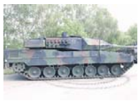
Readiness Joint Task Force — VJTF. 393-й танковый батальон 37-й мотопехотной бригады «Свободное государство Саксония» 10-й танковой дивизии в случае прямой угрозы атакуют в течение нескольких дней до конца выделит на усиление натовских войск не менее 30 танков Leopard 2A7, однако выданы контракты на закупку береговой системы обороны на базе противокорабельных ракет NSM (дальность — до 185 км) и шести РСЗО M142 HIMARS. Об этом сообщила на заседании парламентской комиссии по обороне, внутренним делам и предотвращению коррупции министр обороны Латвии Инара Муриньш. В 2023 году Латвия планирует выделить на оборону около 987 млн евро, или 2,25 процента ВВП страны, а к 2027 году военные расходы должны быть возросли до трёх процентов ВВП.

Окончательное слово в вопросе выбора места постоянной дислокации бригады Bundeswehr, которую планируют разместить в Литве, остаётся за НАТО. Такое мнение 7 марта выразил министр обороны ФРГ Борис Писториус в ходе пресс-конференции в Вильнюсе. «Вопрос не в том, куда планирует Германия, сколько в том, что НАТО считает необходимым», — отметил он. — У нас есть бригада, направленная в Литву, литовская сторона уже начала необходимые процессы создания инфраструктуры. Но, по его мнению, вопрос в том, надо ли иметь постоянно дислоцированную немецкую бригаду в Прибалтике?»