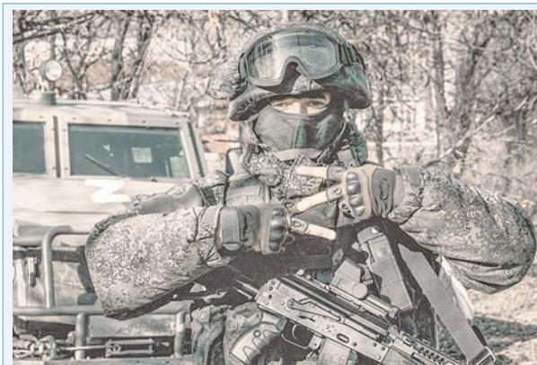
Российские военнослужащие, выполняющие задачи специальной военной операции, знают, что по всей стране и за её пределами проходят масштабные акции в их поддержку. Бойцы искренне благодарят за тёплые слова и передают огромный привет на Родину. Всё обязательно будет хорошо!