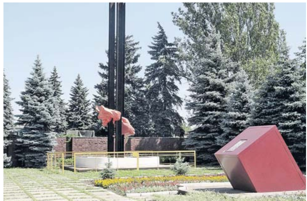
Мемориал у шурфа шахты № 4/4-Бис «Калиновка».

Для сохранения исторической памяти о зверствах нацистского населения Советского Союза — жертв военных преступлений гитлеровцев во время Великой Отечественной войны в рамках проекта «Без срока давности» Центр общественной информации «Фед России» в конце 8 сентября 2023 года (80-я годовщина освобождения города Сталино (ныне Донецка) от немецко-фашистских оккупантов) разместил на официальном сайте ведомств в рубрике «Архивные материалы» раздел «История» цифровые копии ранее не публиковавшихся протоколов допроса нацистских преступников и их пособников. Эти документы свидетельствуют о злодеяниях против мирного населения оккупированных территорий нацистскими карательными подразделениями СД, но и военнослужащими вермахта.