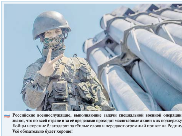
Российские военнослужащие, выполняющие задачи специальной военной операции, знают, что по всей стране и за её пределами проходят масштабные акции в их поддержку. Войскам искренне благодарят за тёплые слова и передают огромный привет на Родину. Всё обязательно будет хорошо!

На Камчатке по инициативе губернатора края запущено производство дронов-камикадзе. Первая партия в самое ближайшее время прибудет в зону специальной военной операции. Это так важно на фронте в отношении нескольких соединений, где продолжают службу камчатские военнослужащие, доставлены очередные комплекты бронезащиты, беспилотники, противодымные ружья и радиостанции. На полуострове продолжается масштабная работа по поддержке СВО. Только с начала этого года «за лето» отправлено более 50 тонн различных грузов.